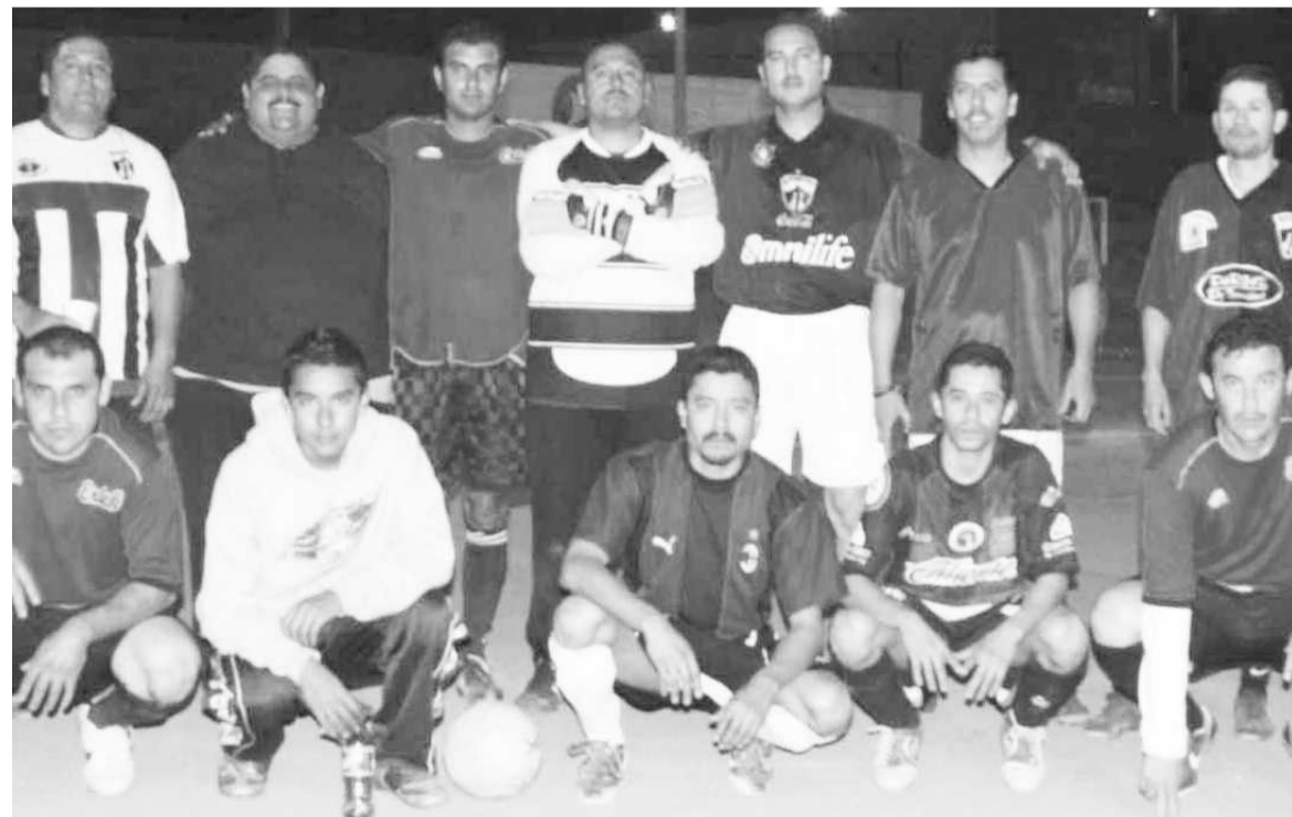
DEPORTIVO 17, que clasificó para la "liguilla" del torneo de copa, lleva de rival al Deportivo Álamos al abrir hoy el torneo de liga de la Liga Mayor de Fútbol de Tijuana.