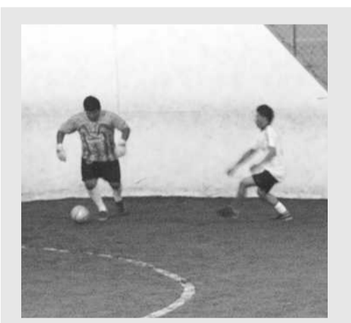
JUEGOS DE PODER a poder surgieron de la fecha del Club Deportivo Samba.