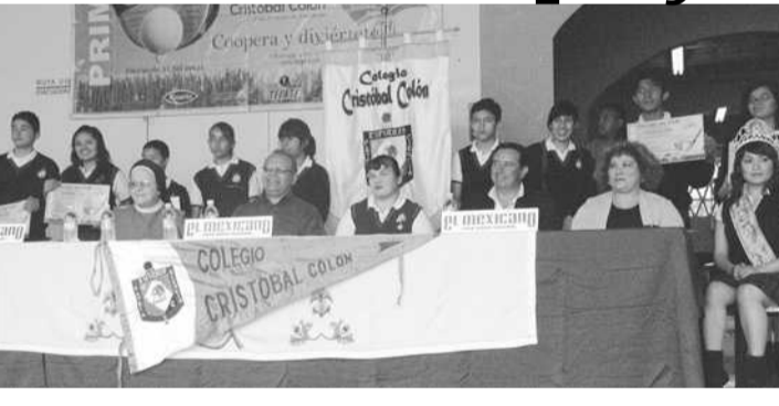
AGRADECIERON a patrocinadores por el apoyo otorgado al torneo de golf del Colegio Cristóbal Colón.

Fueron varios los patrocinadores que contagiados con las necesidades de remozamiento del vetusto inmueble apoyaron la organización de un torneo del deporte de los andarines y