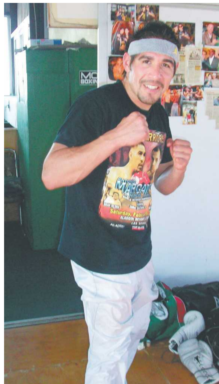
MARGARITO ya quiere dejar en el pasado, el episodio vivido durante y después de la pelea con Shane Mosley.

Dentro de ese proyecto de una magna función se ha ma-