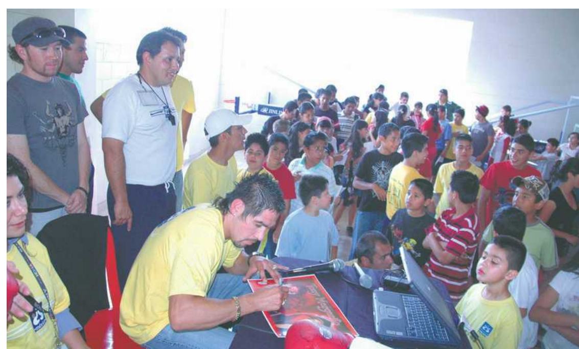
LOS NIÑOS DE ESTE CLUB SE LLEVARON UN AUTÓGRAFO del ex monarca mundial de boxeo.

Cada uno de los jovencitos recibió una fotografía con el autógrafo, así mismo Margarito firmó unos guantes, los cuales quedarán como recuerdo en este centro de atención a niños y niñas.