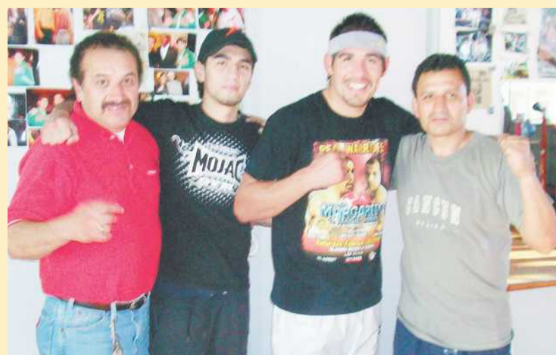
TONY MARGARITO estuvo ayer en el Boys and Girls Club de México.