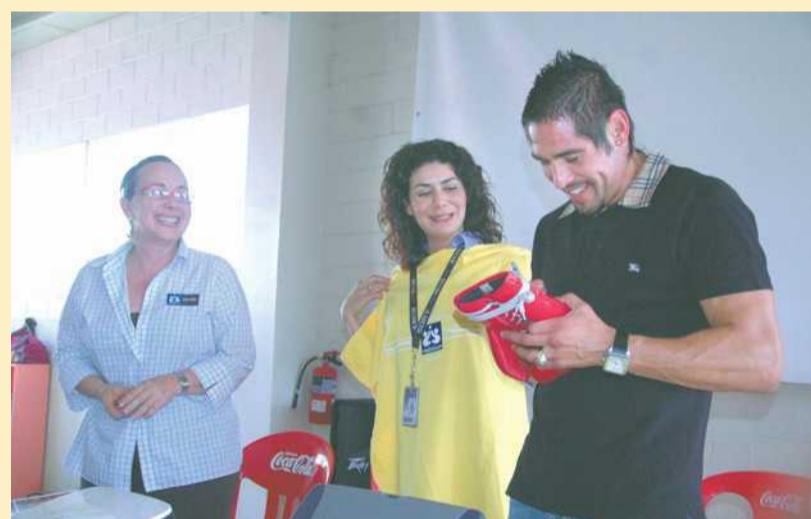
ESTÁ CONSCIENTE y listo para intentar regresar a la grandes peleas.