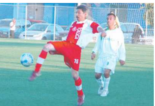
Acciones del futbol de los jueves se tendrá este día dentro de las canchas Casablanca.