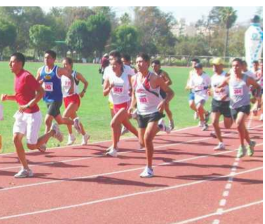
ESTE sábado será la gran carrera del Cinco de Mayo con una distancia de cinco kilómetros.